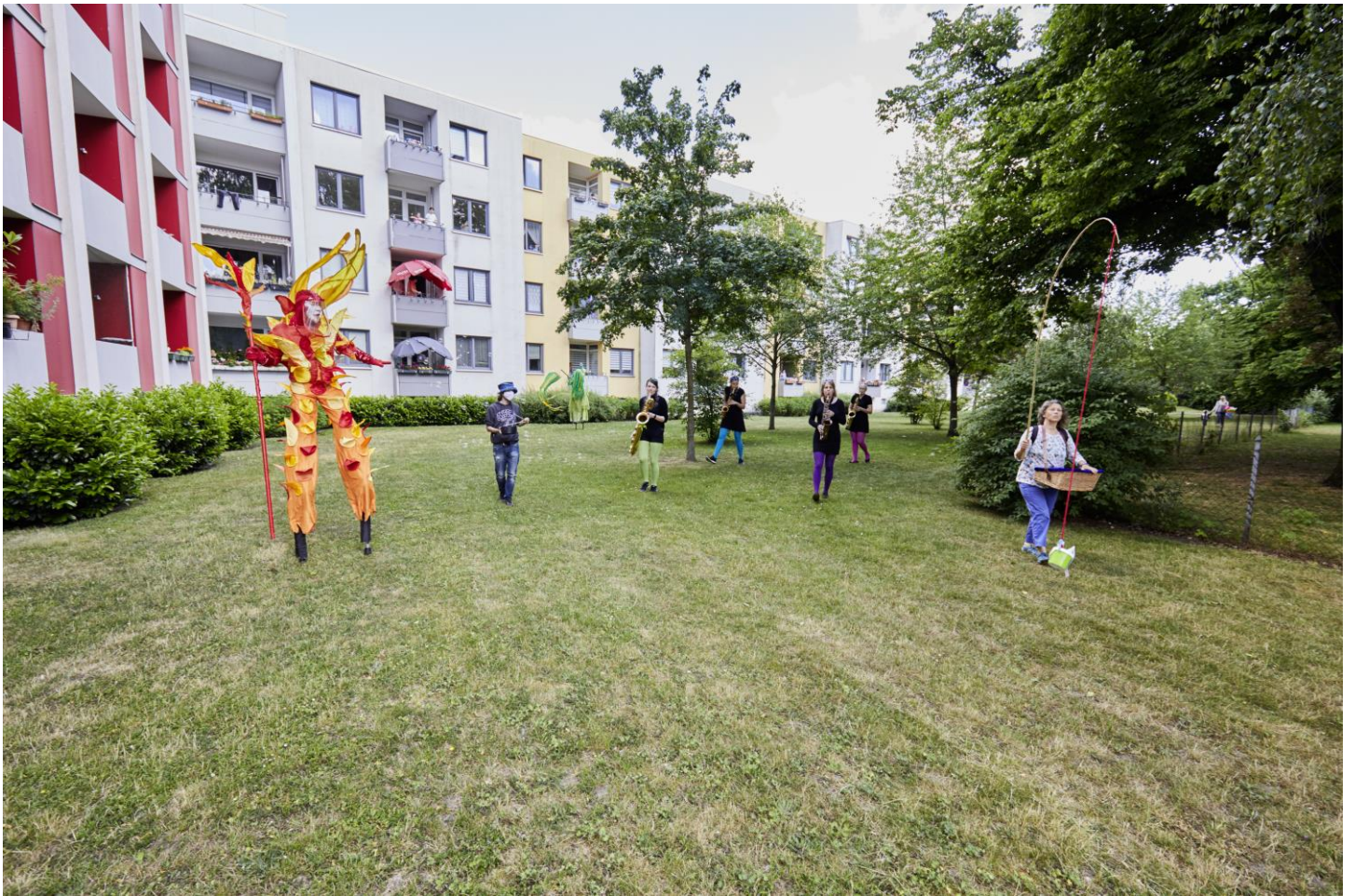
... vor die Plauener Straße 23 ...